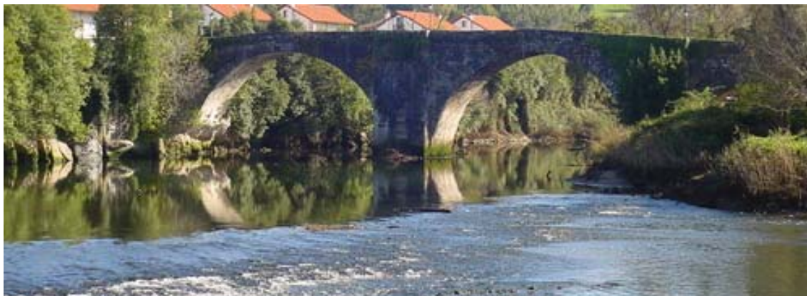
Ilustración 6.- Puente del siglo XVII, Arce.