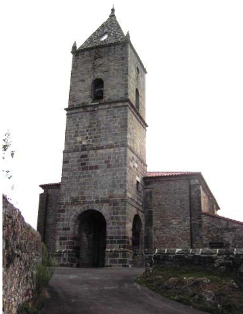
Ilustración 15.- Iglesia de Santa Eulalia de Oruña.

Santa Eulalia de Oruña es un templo de planta rectangular de tres naves, cubierta de doble vertiente y torre a los pies. Pedro de la Sierra comenzó las obras del tramo delantero en el año 1705. Entre 1710 y 1711 Roque Sainz de Otero continúa las obras, a él se debe la construcción del segundo tramo cuya configuración es idéntica al primero, pues se repite el mismo tipo de crucería gótica con combados sobre pilares cruciformes de orden toscano. La fábrica de la torre debió ser coetánea a la edificación del cuerpo del templo. En el año 1744 se añade la sacristía, junto a la capilla mayor en el lado de la Epístola.