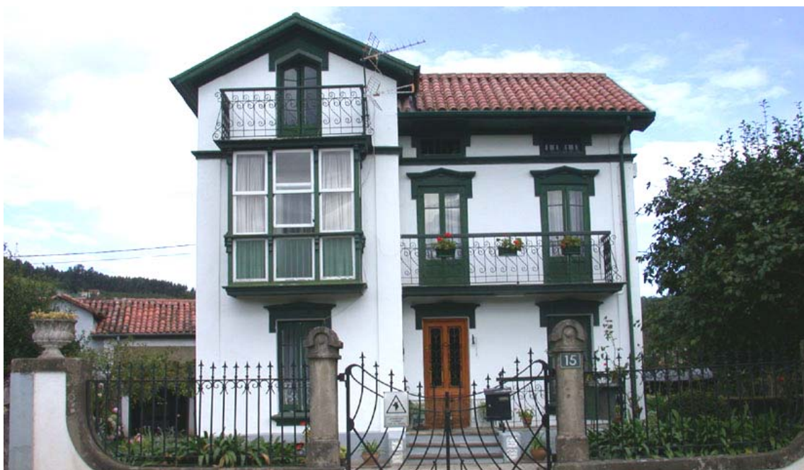
Ilustración 16.- Ejemplo de arquitectura ecléctica en Zurita.