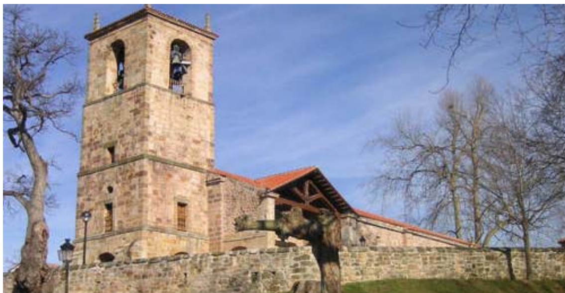
Ilustración 7.- Santuario de Nuestra Señora de Valencia.

En último lugar cabe referencia específica a la imagen de Nuestra Señora de Valencia, talla gótica de mediados del siglo XV. Su ausencia de características definidas impide su adscripción a una escuela determinada, por lo que puede considerarse de carácter popular. La imagen representa a la Virgen sentada en un trono sosteniendo al Niño sobre su regazo y apoyado en su brazo izquierdo, éste sostiene en su mano izquierda una bola simbolizando el globo terráqueo.