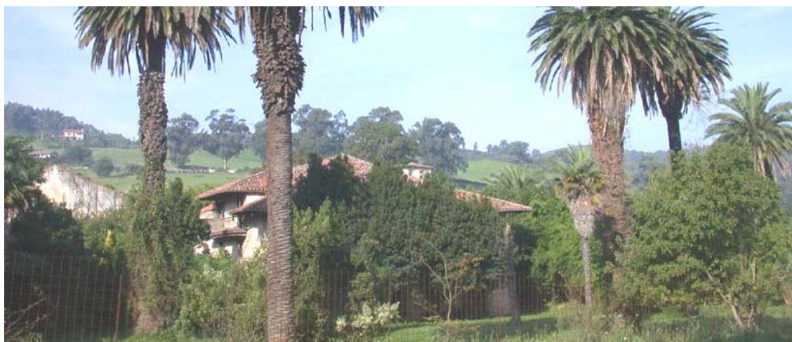
Ilustración 8.- Palacio de los Condes de La Mortera.

El edificio central es de planta rectangular y dos alturas con bajo cubierta estructurada de columnas y tirantes de hierro. La fachada principal meridional se abre mediante galerías de madera.