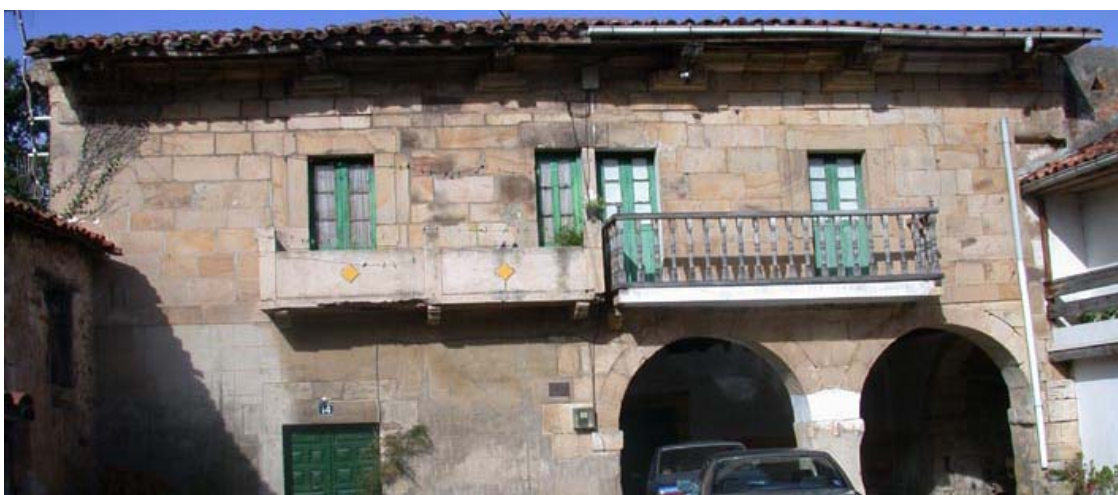
Ilustración 11.- Palacio de la Flor.

Levantado en el barrio Macorra de Carandía en el siglo XVII e incluido en el Inventario General de Patrimonio Cultural de Cantabria como Bien Inventariado en el año 2007 17 . El conjunto se compone de casa principal, patio dependencias anexas, corralada e hipotética portalada. La casa es de dos plantas, con soportal de doble arco de medio punto en planta baja, elemento recurrente en este tipo de residencia noble. Se emplean sillares de gran calidad en la composición de la portada, como queda patente en la cornisa moldurada y de gran volumen que recorre esta pared principal.