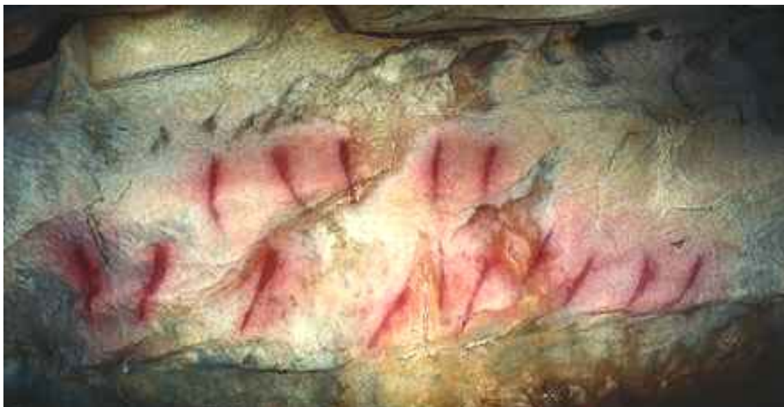
Ilustración 2.- Signos en la Cueva de Santián o Santiyán.

El castillo de Pedraja se alza sobre el monte del Castillo, en la estribación más oriental del monte Tolío (La Picota), sobre el pueblo de Lienres.