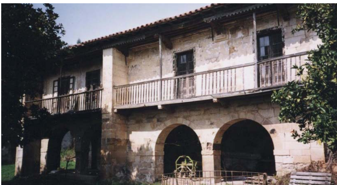
Ilustración 9.- Palacio de La Llana o de La Colina.

El conjunto se completa con la casa de los renteros, probablemente del siglo XIX, y con la ermita de San Antonio de Padua (1739), con capilla mayor, sacristía y retablo fechado entre 1720 y 1730.