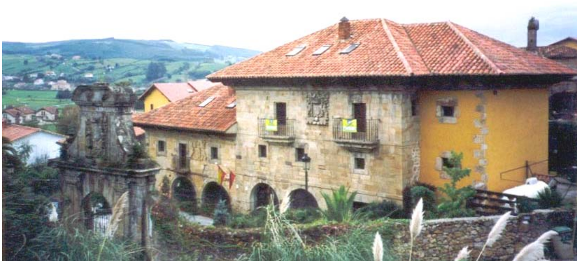
Ilustración 4.- Palacio del Marqués de la Conquista Real.