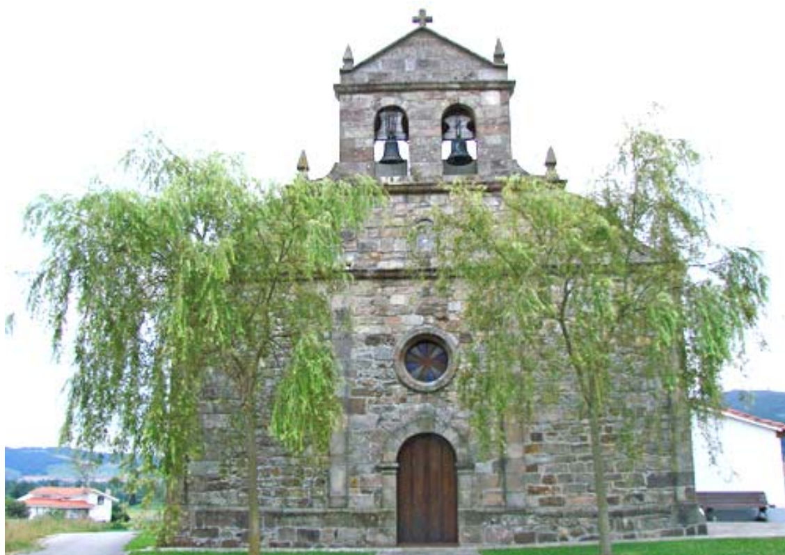
Ilustración 14.- Iglesia de San Julián de Zurita.