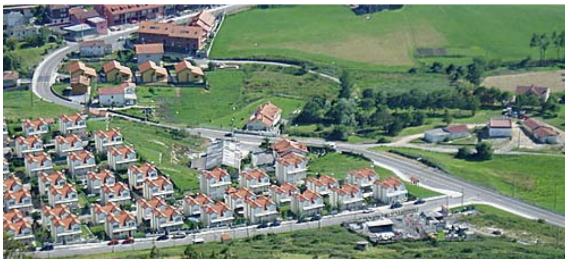
Ilustración 17.- Urbanización en Boo de Piélagos.

Al descrito entramado de poblamiento principal se superpone el de barrios y viviendas diseminadas. Tradicionalmente esta dispersión quedaba reservada para aquellas zonas de difícil acceso, asociadas normalmente a la explotación ganadera y otras labores de actividad primaria. En los últimos años el fenómeno de dispersión del poblamiento adquiere cierta entidad con la proliferación de urbanizaciones de chalets individuales, cerca de las principales vías de comunicación y en los pueblos del tercio septentrional. Este fenómeno de dispersión adquiere notable trascendencia en cuanto que obra la desarticulación de territorio mediante la habilitación de elementos completamente independientes del núcleo originario, desde un punto de vista espacial y funcional. Son ejemplos de esta dispersión los núcleos de Boo y Arce.