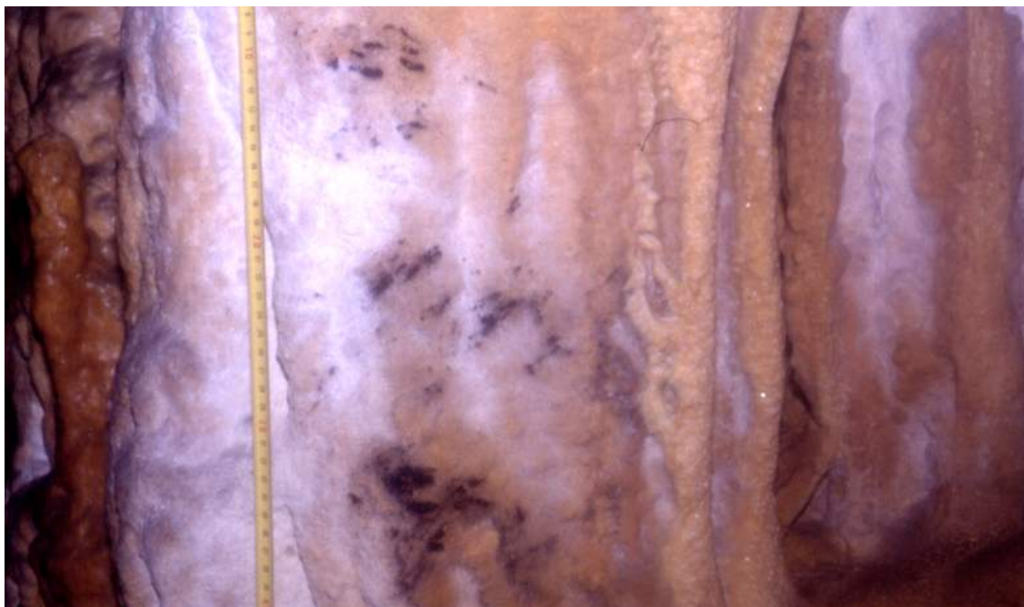
Ilustración 13.- Ejemplo de Arte esquemático-abstracto en la Cueva de Portillo del Arenal.

Cueva de Portillo del Arenal 19 . Se localiza en el barrio del Velo, es una cueva-sima de entrada reducida, situada en una pequeña colina. La superposición de estratos ofrece cronologías de diferentes épocas: Neolítico Antiguo, Neolítico Final/Calcolítico Antiguo, Bronce Antiguo, Tardo-Antiguo y Altomedieval.