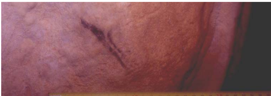
Ilustración 1.- Ejemplo de Arte esquemático-abstracto en la Cueva del Calero II.

El emplazamiento custodia un importante y complejo yacimiento arqueológico compuesto por elementos que van desde del Paleolítico a la Edad Media. La datación de los hallazgos más antiguos se ha consensuado en el Gravetiense, atendiendo tanto a paralelos estilísticos (estilo Il Leroi-Gourham) como por una datación absoluta por Carbono 14 que arrojó una fecha de 25.000 años de antigüedad. El yacimiento fue descubierto por el C.A.E.A.P. ( Colectivos para la ampliación de estudios de Arqueología Prehistórica ) a finales del pasado siglo.