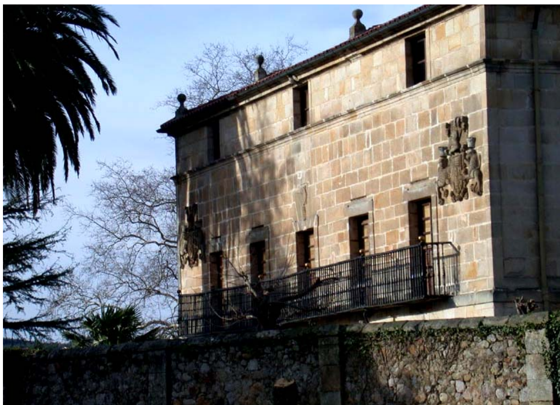
Ilustración 10.- Palacio y capilla de los Bustamante.

Puente representativo de las pequeñas obras públicas en el ámbito rural incluido en el Inventario General de Patrimonio Cultural de Cantabria como Bien Inventariado 16 . Es además significativo exponente de la tradicional unión entre las vías de comunicación y el agua. Este tipo de obra de ingeniería tiene doble significado, ya que tradicionalmente ha existido una cultura muy relacionada con el agua en el municipio de Piélagos (molinos, fuentes, pozos, etc.), y por otro lado tiene un gran valor estratégico como lugar de cruce de importantes vías de comunicación.