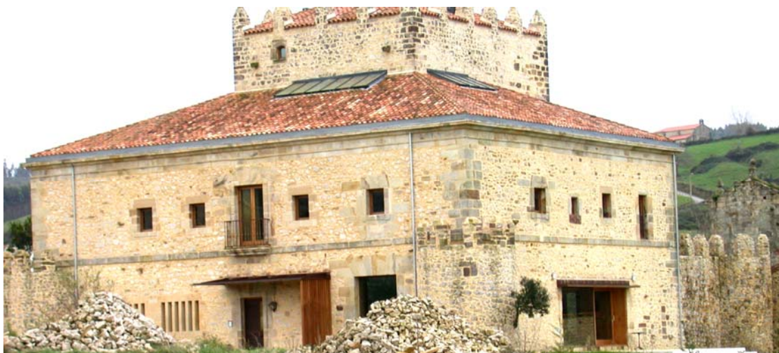
Ilustración 5.- Torre de Velo.

Elemento más emblemático de ingeniería civil del municipio de Piélagos, declarado BIC en el año 1985.